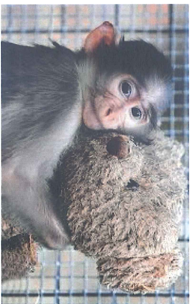
Expérience de privation affective chez le singe.